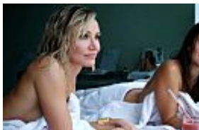
The Counselor (Teaser)