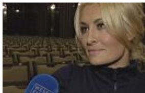
Sarah Connor in Bremen