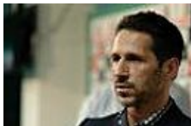
Eichin: "Es war beeindruckend"