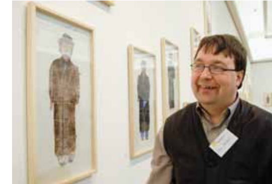
AUSGEZEICHNET Der euward-Kunstpreis für Außenseiter-Kunst wird seit 2000 regelmäßig in München verliehen.