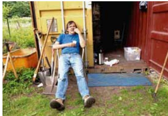
EINFACH HINGEPFLANZT Nach getaner Arbeit ist Zeit für eine kurze Pause auf der Gemüsewerft in Bremen.