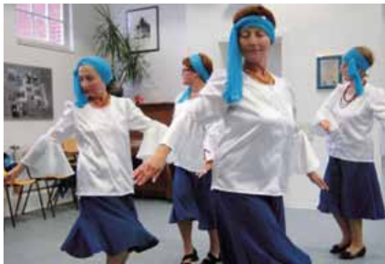
MUSIK BEWEGT Die Kieler Volkstanzgruppe „Simcha“ ist in ganz Schleswig-Holstein bekannt und tritt auf Festivals auf.