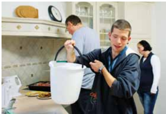
UNTER EINEM DACH Die Wohngemeinschaft bereitet auf das selbstbestimmte, ambulant betreute Wohnen vor.