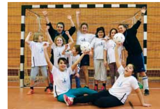
MÄDELS VOR – NOCH EIN TOR! Gemeinsam trainieren, spielen und Spaß haben in Berlin-Kreuzberg.

PROJEKT Kick it – Mädchen erobern den Fußball TRÄGER Stiftung Sozialpädagogisches Institut Berlin – Walter May THEMENFELD Freizeit