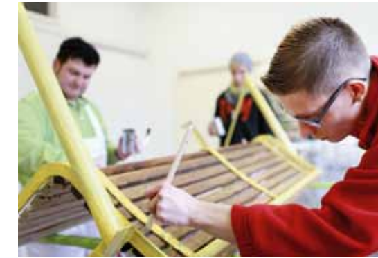
RAN AN DIE ARBEIT Die Lehrlinge im Werkhof St. Josef werden unter fachmännischer Leitung ausgebildet.

PROJEKT Werkhof St. Josef TRÄGER stiftung st. franziskus heiligenbronn THEMENFELD Arbeit ORT Heiligenbronn